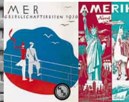
+++ Unternehmen mit Tradition +++