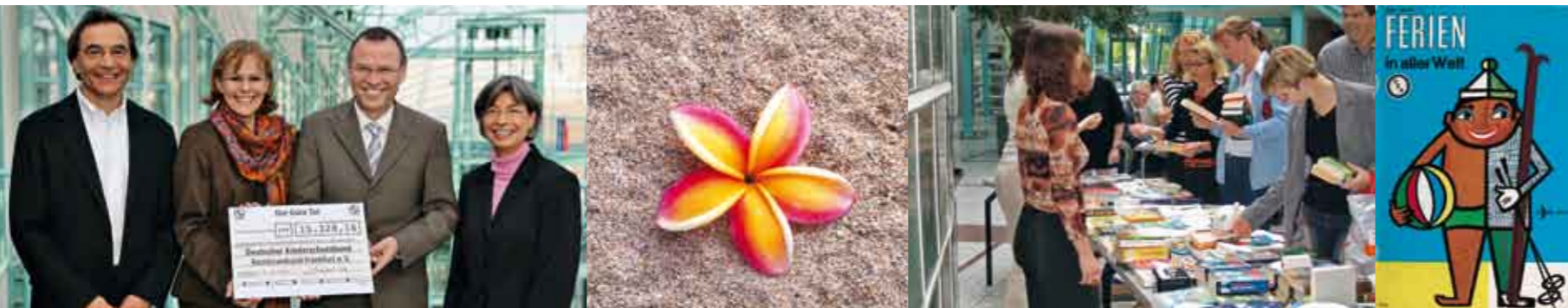
+++ Gesellschaftliche Verantwortung übernehmen: Die Unternehmensgruppe engagiert sich für das Wohl von Kindern +++

tätigen Kinderrechtsorganisation ECPAT für die Kinderrechte und gegen sexuellen Missbrauch ein. Gemeinsam wurde ein umfangreicher Verhaltenskodex vereinbart.