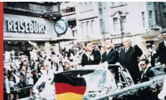
+++ Ein Unternehmen im Wandel der Zeit +++

1980 Deutsche Lufthansa acquired a 10.8 percent share in DER, other shareholders were the German railway company (Deutsche Bahn) (50.1), Hapag Lloyd (25.1) and abr-Reisebüro (14.0). 1981 LTU founded Meier's Weltreisen. 1983 The Dertour brand was launched. The pilot catalogue was "Europe's Green Oases", which was quickly followed by additional special catalogues. All travel catalogues were switched over to the Dertour name in 1986. 1992 Founding of ADAC Mitgliederreisen. 1995 Consolidation of shares in DER by Deutsche Bahn (66.8 percent) and Deutsche Lufthansa (33.2 percent). 1997 abr merged with DER. The new Phoenix reservation system went into operation. 1998 Lufthansa pulled out as a shareholder in DER; Deutsche Bahn became the sole shareholder. Dertour and DER Sales, which consists of the DER Reisebüro and DER Business Travel business divisions, began operating as independent subsidiaries of Deutsches Reisebüro GmbH. 1.1.2000 Rewe-Zentralfinanz eG, Cologne, acquired all DER shares held by Deutsche