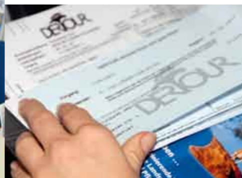
... geschrieben +++