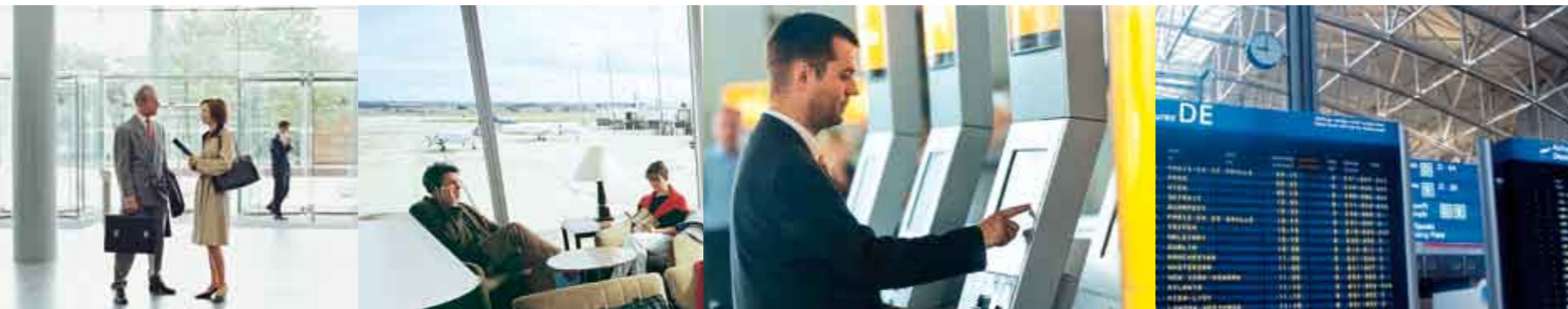
+++ Unter der Marke DER Corporate Services werden spezialisierte Leistungen rund um die Geschäftsreise angeboten +++

Für Firmen, die gezielt Reisen für Marketingzwecke und als Kundenbindungsinstrument einsetzen, stellt Reisewelt spezielle Reiseangebote zusammen. Ob kleine exklusive Touren oder längere Erlebnisreisen – Reisewelt verfügt über langjährige Erfahrungen und ausgezeichnete Kontakte zu touristischen Unternehmen in der ganzen Welt. Ein hoch spezialisiertes Team steht für die Konzeption und Durchführung der Reisen bereit.