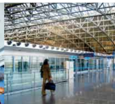
+++ Die Geschäftsreisen-Organisation in sichere Hände geben – unsere Spezialisten bieten innovative Lösungen +++